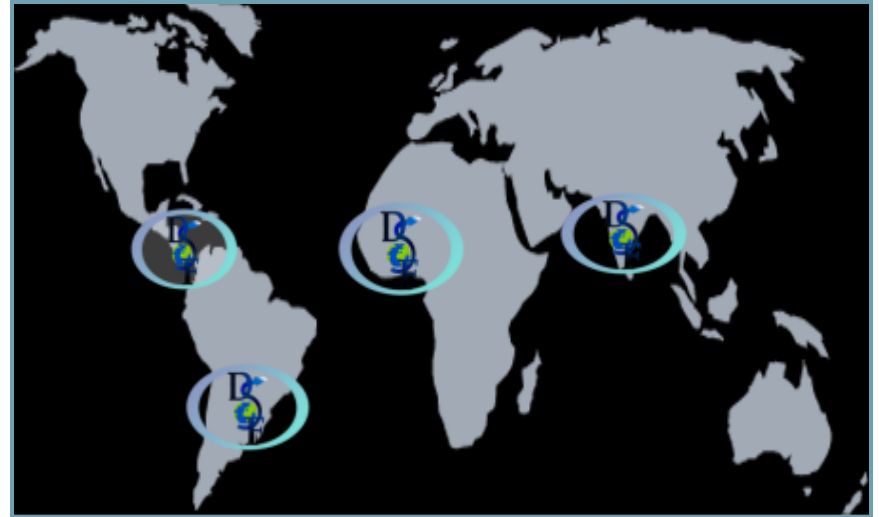
Principales zones géographiques d'intervention des membres