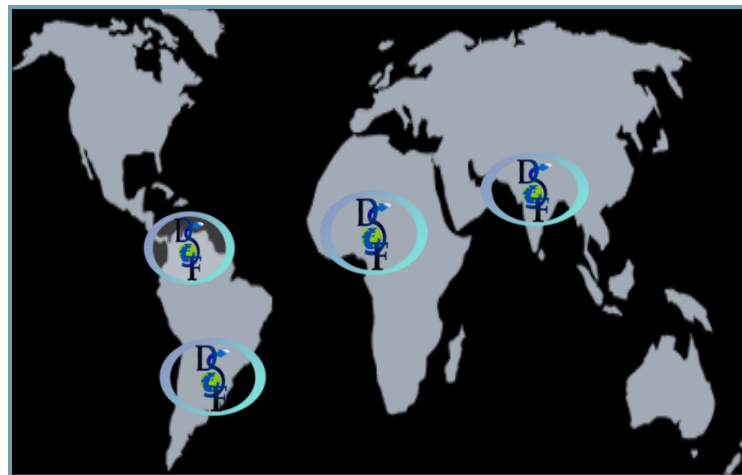
Principales zones géographiques d'intervention des membres